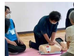
※AEDを使っでの心肺蘇生法