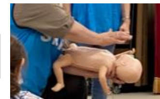
※乳児の誤飲時の対処法