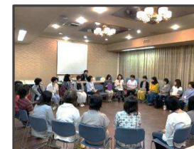
前期養成講座の様子

♡あなたのスキルをアップするために受講しませんか? 現在、サポート活動をしている方はもちろん、しばらく活動していないから不安という方、子育てを取り巻く環境について学びませんか? また救命救急講習については3年に一度は受講をおすすめします。